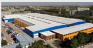
Hörmann Beijing, Китай