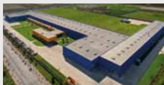
Hörmann Tianjin, Китай