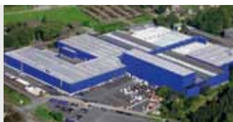
Hörmann KG Amshausen, Германия