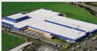
Hörmann KG Ichtershausen, Германия