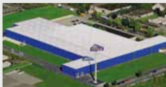
Hörmann KG Dissen, Германия