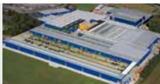
Hörmann KG Brockhagen, Германия