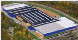
Hörmann KG Eckelhausen, Германия