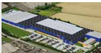
Hörmann KG Brandis, Германия