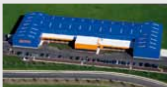
Hörmann Flexon LLC, Burgettstown PA, США

Hörmann – единственный производитель на международном рынке, предлагающий «из одних рук» все основные строительные элементы, которые изготавливаются на высокоспециализированных предприятиях в соответствии с новейшими техническими достижениями. Имея широкую торговую и сервисную сеть в Европе и представительства в Америке и Китае, Hörmann является надежным поставщиком высококачественных строительных конструкций. Hörmann – качество без компромиссов.