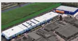
Hörmann Alkmaar B.V., Нидерланды