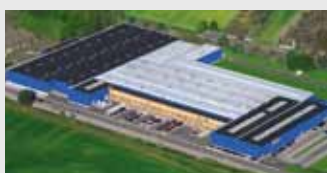
Hörmann KG Werne, Германия