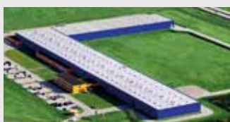
Hörmann Legnica Sp. z o.o., Польша