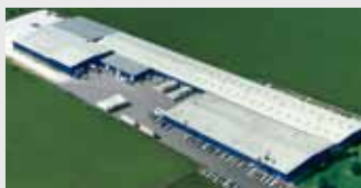
Hörmann LLC, Montgomery IL, США