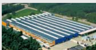
Hörmann Genk NV, Бельгия