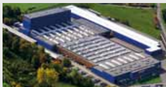
Hörmann KG Freisen, Германия