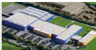
Hörmann KG Antriebstechnik, Германия