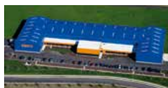
Hörmann Flexon LLC, Burgettstown PA, EE.UU.