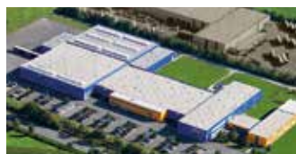
Hörmann KG Antriebstechnik, Alemania