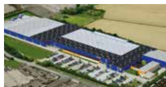
Hörmann KG Brandis, Alemania