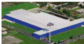
Hörmann KG Dissen, Alemania