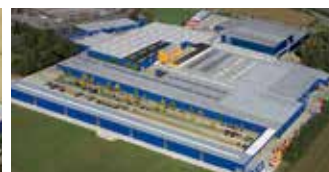
Hörmann KG Brockhagen, Alemania