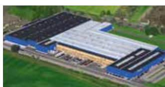
Hörmann KG Werne, Alemania