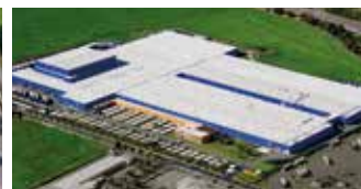
Hörmann KG Ichttershausen, Alemania