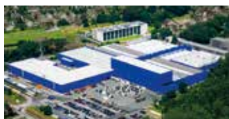
Hörmann KG Amshausen, Alemania