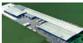
Hörmann LLC, Montgomery IL, EE.UU.