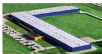
Hörmann Legnica Sp. z o.o., Polonia