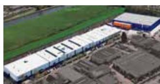
Hörmann Alkmaar B.V., Países Bajos