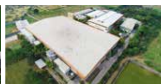
Shakti Hörmann Pvt. Ltd., India

El Grupo Hörmann es el único fabricante en el mercado internacional que ofrece todos los elementos principales de construcción de fabricación propia. El material se fabrica en centros altamente especializados y con métodos y técnicas al más alto nivel. Mediante una red especializada de distribución y servicio en Europa y con presencia en América y Asia, Hörmann es para usted el interlocutor internacional más capacitado para grandes proyectos de construcción con una calidad incondicional.