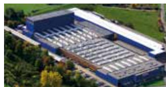
Hörmann KG Freisen, Alemania