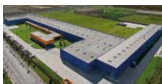
Hörmann Tianjin, China