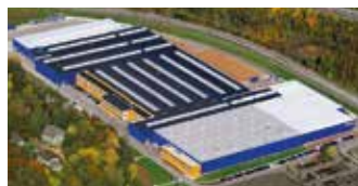
Hörmann KG Eckelhausen, Alemania