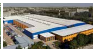
Hörmann Beijing, China